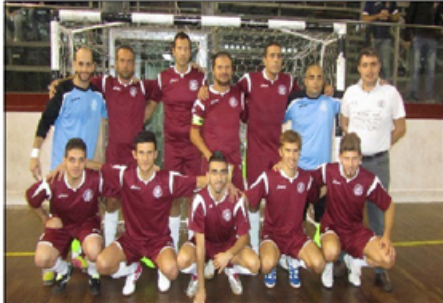
Il Gruppo sportivo Ens Reggio Calabria