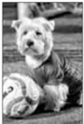
Mascotte della Pro Reggina

Calcio a 5-serie A Pro Reggina il calendario fotografico delle atlete